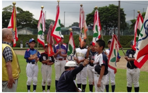
（スポーツ少年団31チームの代表による「選手宣誓」）