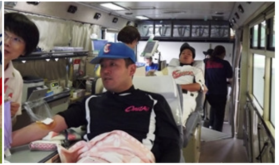
（指導者の方々に献血のご協力を頂き、ありがとうございました。）