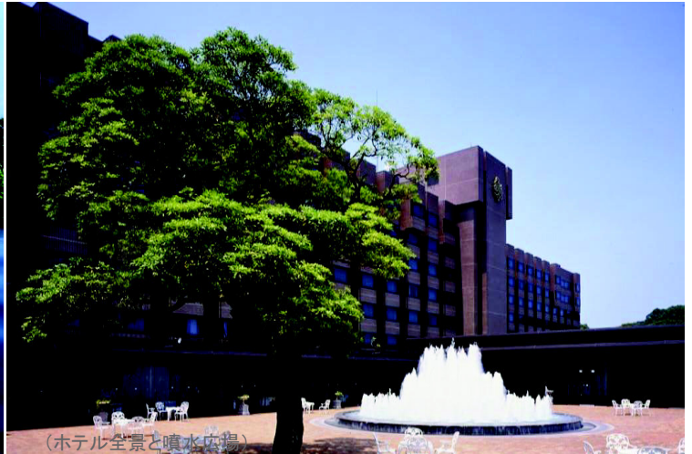
(ホテル全景と噴水広場)