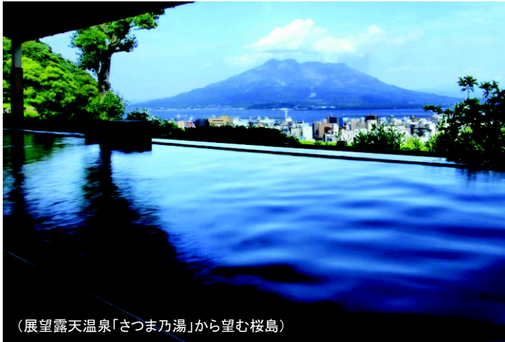
(展望露天温泉「さつま乃湯」から望む桜島)

城山観光ホテル 〒890-8586 鹿児島市新照院町41番1号 代表TEL(099)224-2200 / FAX(099)224-2222 http://www.shiroyama-g.co.jp