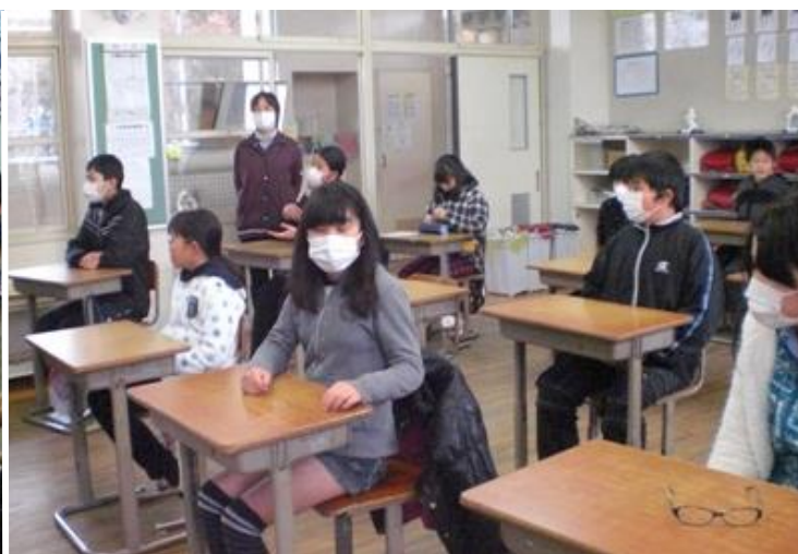
(曾於市立諏訪小学校6年生・保護者・先生を対象とした「薬物乱用防止教室」を開催。-2月21日-)