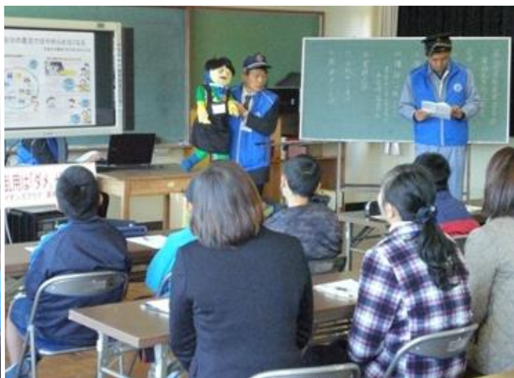
(曾於市立光神小学校児童・保護者・先生を対象とした「薬物乱用防止教室」を開催。-2月13日-)