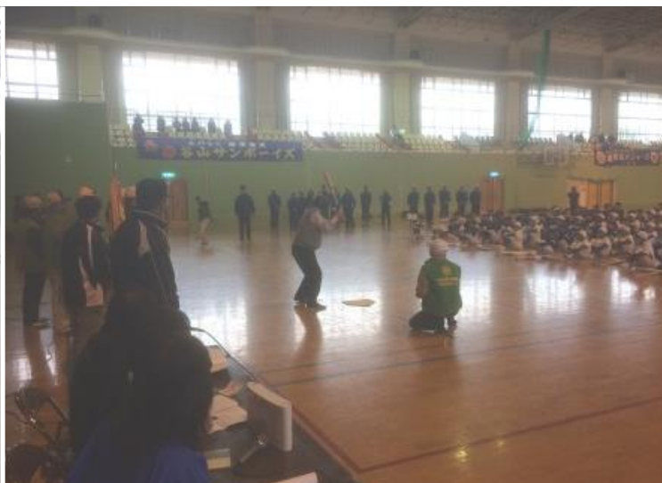
(硬式少年野球谷山大会は、雨のため屋内での始球式。)