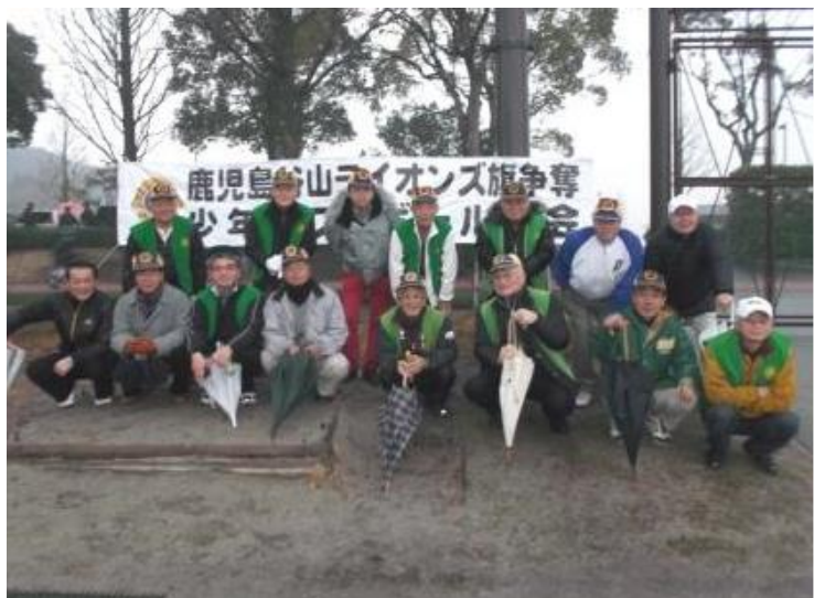
(鹿児島谷山 LC 旗争奪少年ソフトボール大会集合写真。)

2月8日(日)第34回鹿児島谷山ライオンズ旗争奪少年ソフトボール大会、硬式少年野球谷山大会の開会式に参加致しました。今年はいにく雨に見舞われ開会式のみで、天候回復を待ちましたが試合は延期となりました。その為両大会とも2月11日(水)に試合を開催致しました。スポーツを通して青少年の健全育成の為、今後も続けていきたいと思っております。(2月8日)