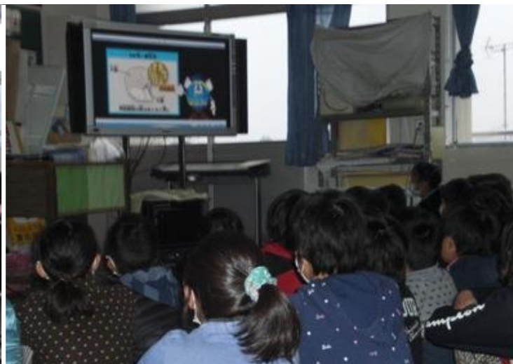
(講師の説明に熱心に耳を傾け、薬物に対する「ダメ。ゼッタイ。」への新たな知識を吸収しようとする強い意気込みが感じられた。-1月21日-)