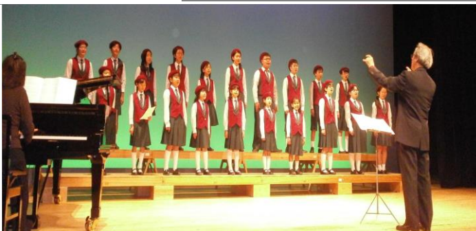
（少女の意見が堂々と発表され、発表の途中でのアトラクションタイムに、始良市少年少女合唱団の澄みきった合唱がありました。）