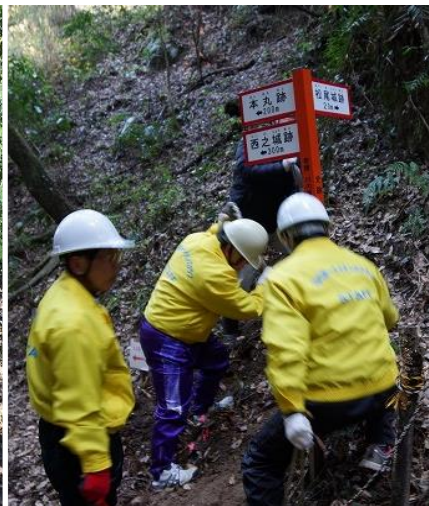
（案終盤における案内板の設置）