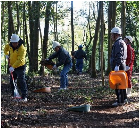
（散策道の補修整備に汗を流す。）