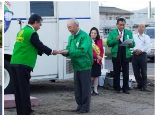
(谷山中学校での配布の様子) (JR 谷山駅での助成金贈呈の様子)

谷山ふるさと祭り 鹿児島信用金庫 谷山支店駐車場 参加者ライオン 27名 ライオンレディ 5名