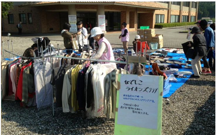
(学園祭でのフリーマーケットを実施。事業資金造成。)