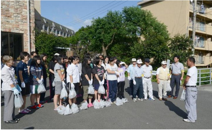
(投入前に担当委員長より説明を受けました。)

9月に製作しておいたEM菌活用団子500個を神村学園内の硯川と尻塞川に投入した。当日は午後3時に神村学園初等部に集合し、神村学園高等部の寮生と先生方23名にお手伝いを頂きそれぞれ歩きながら河川に投入していった。投入を初めて5年目となるが、当初の頃より臭いがなくなり、水がきれいになっているようである。(10月9日)