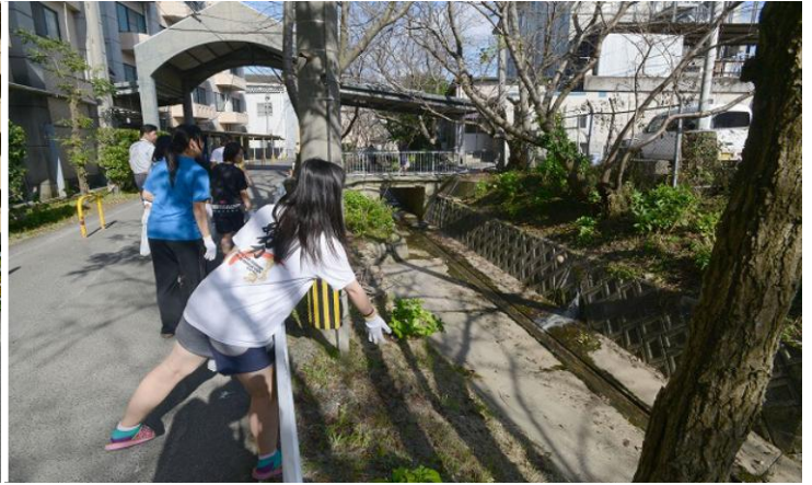
(神村学園高等部寮生と先生方も協力。エイ! 遠くまで届け!)