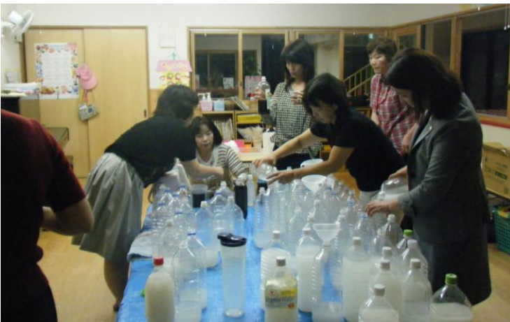
(環境保全活動の一環として、亀山小学校プールに投入する。)