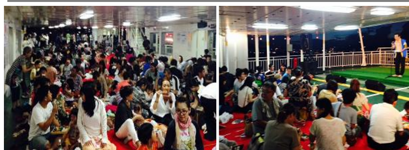
(総勢 556 名の皆様と懇親の様子)

桜島フェリー納涼観光船にて、鹿児島県交通被災者 40 名 鹿児島大学教育学部付属特別支援学校生徒 80 名を招待し「明日へ繋ごう青少年とのタベ」納涼会を開催した。スポーツ少年団の子供達や保護者など 総勢 556 名の皆様とクラブ会員は対応と接待に楽しいひとときを過ごした。薩摩剣士隼人(ポケモン)のキャラクターと RODDY の音楽ショーは子供たちも大喜びでアトラクションを楽しんでいた。また船上にて チャリティー益金の贈呈式を行いチケット購入いただいた皆様と共に支援の輪を広げ 多くの賛同を得ることが出来た。「夏休みの楽しい思い出になりました。」と、ご招待した団体の皆様にも大変喜んでいただいた。今後とも青少年健全育成支援に力を入れ進めていきたいと思う。 (8月21日)