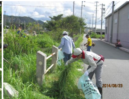
(猛暑に負けず頑張りました！！ 池原会長より燃料寄贈)