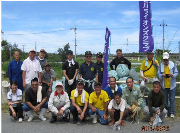
(清掃を終え、沢山のゴミ袋を囲み 笑顔でポーズ。)

石川川清掃活動 うるま市総合体育館（うるま祭り会場） 会員(10名) ノンライオン(12名)